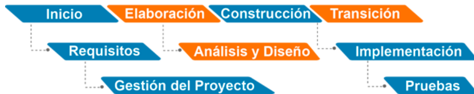
Ilustración 1. Proceso Unificado comparado con el ciclo de vida de software(AIGroup, 2017).