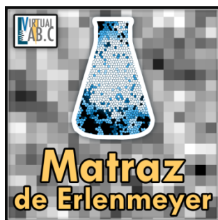
Figura.2. Marcador que actualmente se utiliza en el proyecto de laboratorio virtual y cuenta con una evaluación de 5 estrellas.

En la figura 2, se muestra el patrón que actualmente se utiliza en la aplicación, este patrón incluye el logotipo del proyecto, el equipo que se va a utilizar cuyo fondo ya cuenta con un patrón propio, el nombre del equipo y el fondo base se encuentra también con un patrón en escala de grises. Cabe señalar que los colores no influyen en la eficiencia del marcador en la realidad aumentada.