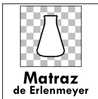
Figura.1. Primer marcador generado para el proyecto de Laboratorio Virtual.

Para cumplir con el objetivo final, el primer paso fue determinar los marcadores “ markers ”, los cuales son imágenes únicas que servirán como referencia para cada uno de los elementos del laboratorio. Para determinar el diseño del marcador se analizaron las cantidades que se necesitarían de los mismos, para ello se consideraron los ciento dieciocho elementos de la tabla periódica, así como ochenta y seis instrumentos de laboratorio de química y además material extra que se puede requerir en las diferentes prácticas, por ejemplo, globos, pastillas efervescentes u otros, obteniendo un aproximado de 210 marcadores diferentes. El primer patrón generado con un nivel de una estrella (eficiencia baja) se muestra en la figura 1, éste fue descartado porque no permite generar de manera aleatoria cierto número de marcadores, dado que tendía a repetir patrones. Este marcador sólo contiene un patrón sencillo, formado por una cuadrícula y utilizando una escala de grises, también se le incorporó la figura del material con ningún patrón en su interior y en la parte inferior se colocó el nombre del equipo sobre un fondo blanco.